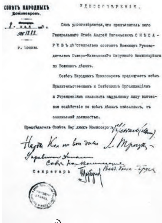
°5 Удостоверение Снесарева, подписанное Лениным и Троцким. 1918 г.